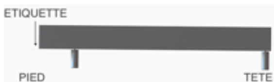
Configuration pieds décalés